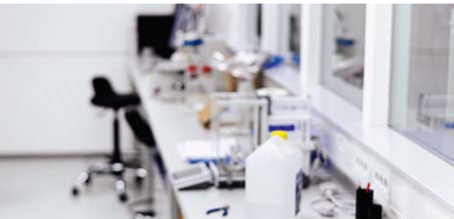
Laboratory for thermal analysis Labor für thermische Analyse