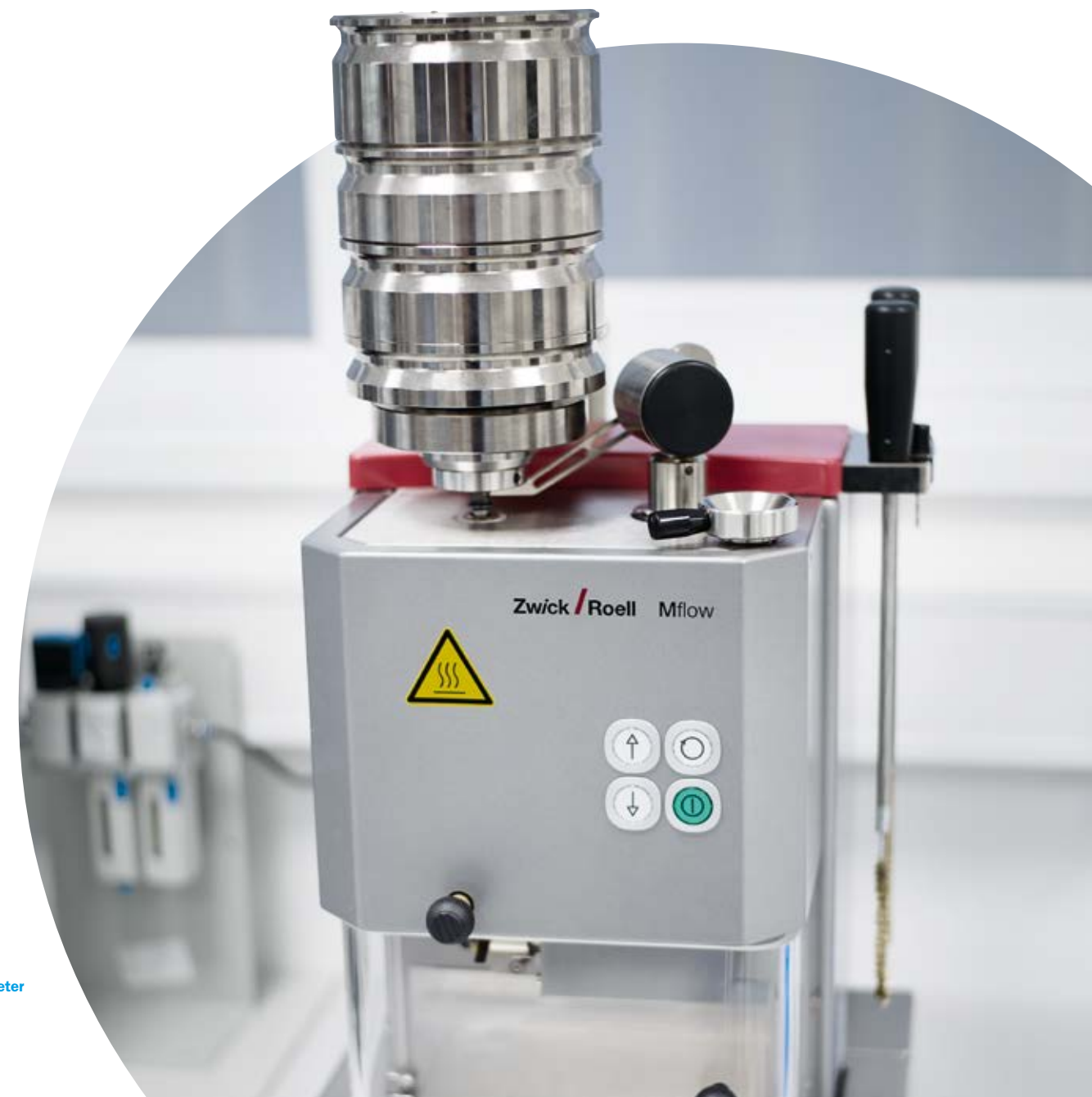
Extrusion plastometer Fließprüfgerät