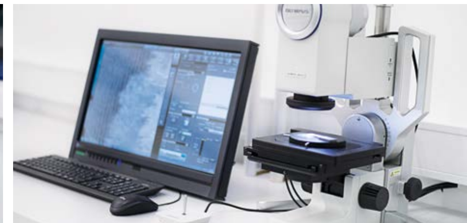
Digital microscope Digitalmikroskop