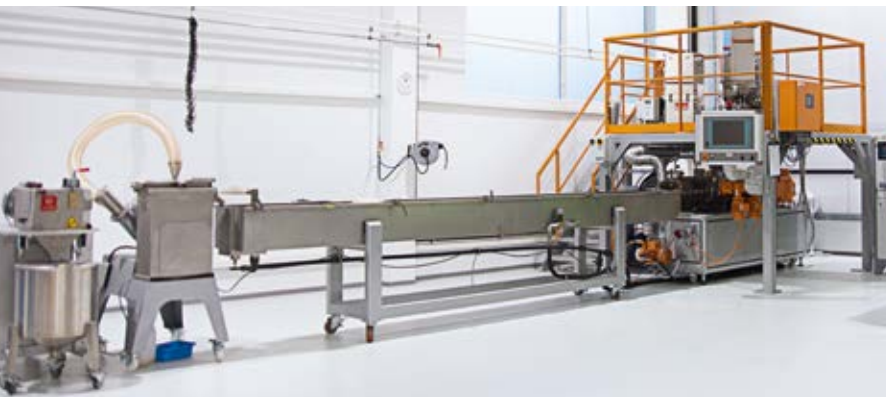
Twin-screw extruder with strand granulator Doppelschneckenextruder mit Stranggranullierung