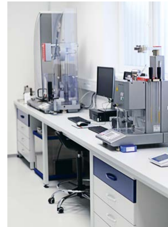
Tensile tester and extrusion plastometer Pendelschlagwerk und Fließprüfgerät

Der Widerstand des Materials gegen Schläge wird in einem Schlagversuch nach Charpy und Izod gemessen, mit oder ohne Kerbe und bei 23 °C und -30 °C. Die Prüfungen werden nach den Normen ISO 179, ISO 180 ausgeführt.