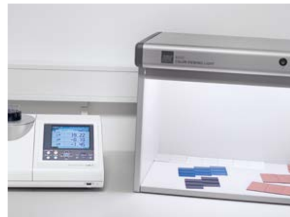
Spectrophotometer with light cabin Spektralphotometer mit Lichtkabine