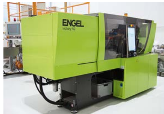
Injection molding machine Spritzgießmaschine