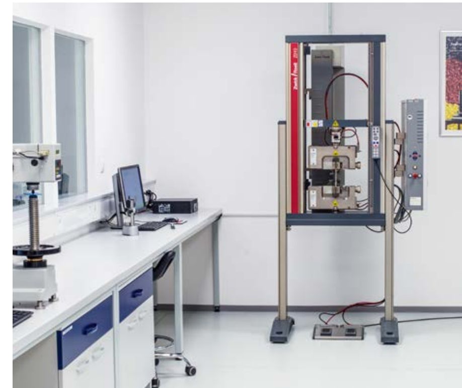
Hardness tester and universal testing machine Härteprüfgerät und Zugprüfmaschine