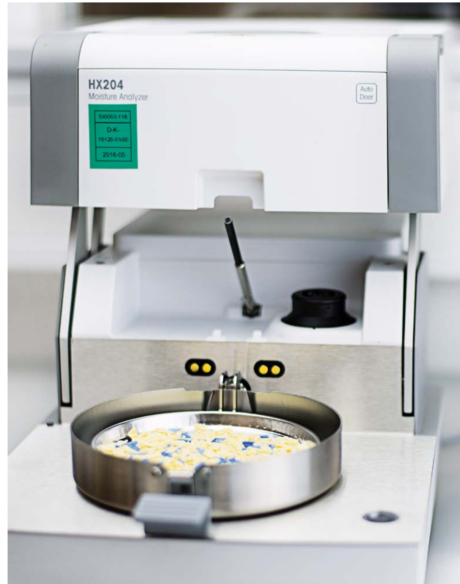
Moisture analyzer Feuchtemessgerät