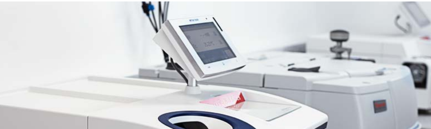
DSC, FT-IR and TGA DSC, FT-IR und TGA